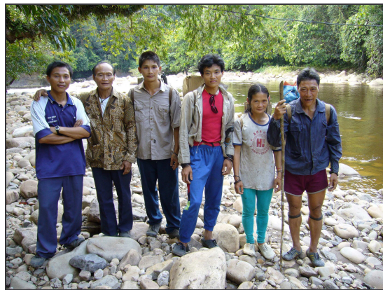
Penan Familien auf dem Heimweg nach einem Treffen mit dem Projektteam – März 2006